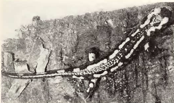
Abb. 3. Typischer fleckenstreifiger Feuersalamander, Fredeburg (Kr. Meschede), Dezember 1961; von oben (Gefangenschaftsaufnahme)

Salamandra salamandra terrestris Lacépède, bewohnt 11) . Diese Rasse, die Freitag (1962, p. 65) dem gemäßigt atlantischen (subatlantischen) Geoelement zuordnet, zeigt auf dem Rücken zwei gelbe Längsstreifen, die in der Regel mehrfach von der schwarzen Grundfarbe unterbrochen sind; die Rückenmitte ist schwarz 12) . Die beiden Rassen sind ein Beispiel für ein durch die pleistozäne Sonderung entstandenes Formenpaar.